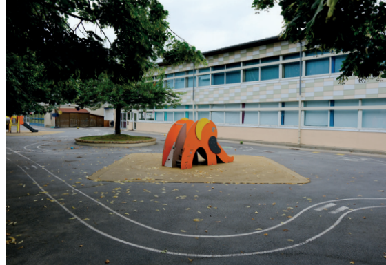
Rue Albert Pichon