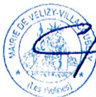
Pascal Thévenot Maire

En vertu de l'article L.2131-1 du C.G.C.T. le Maire de Vélizy-Villacoublay atteste que le présent document est exécutoire.