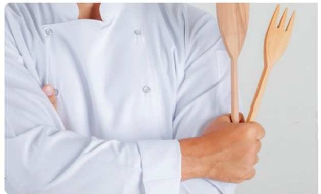
Bars Et Restaurants