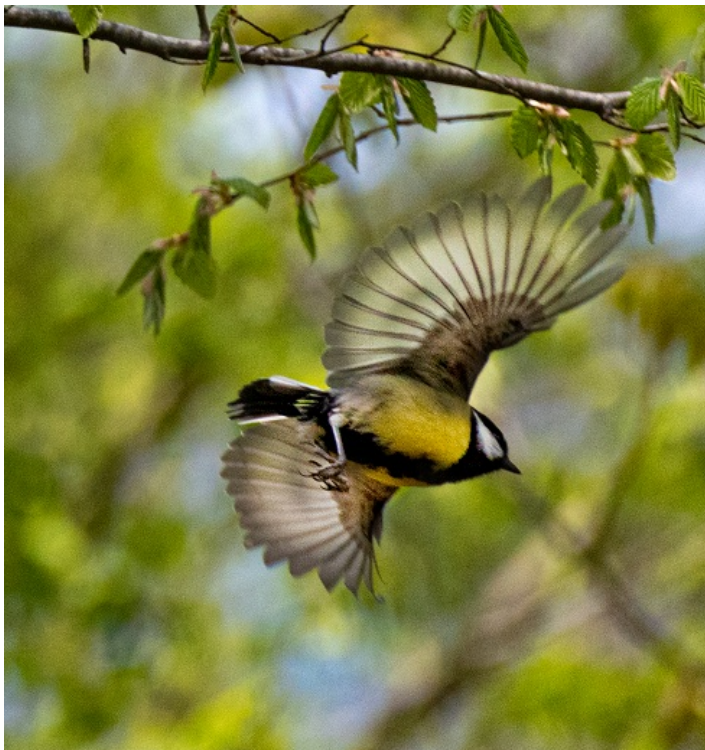
Vol de Mésange

Si vous vous déplacez sans faire de bruit, les chevreuils sont rares et craintifs, mais il est possible d'en apercevoir à n'importe quelle heure de la journée. Les écureuils et les hérissons figurent aussi parmi les mammifères que l'on peut croiser.