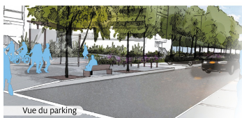
Vue du parking