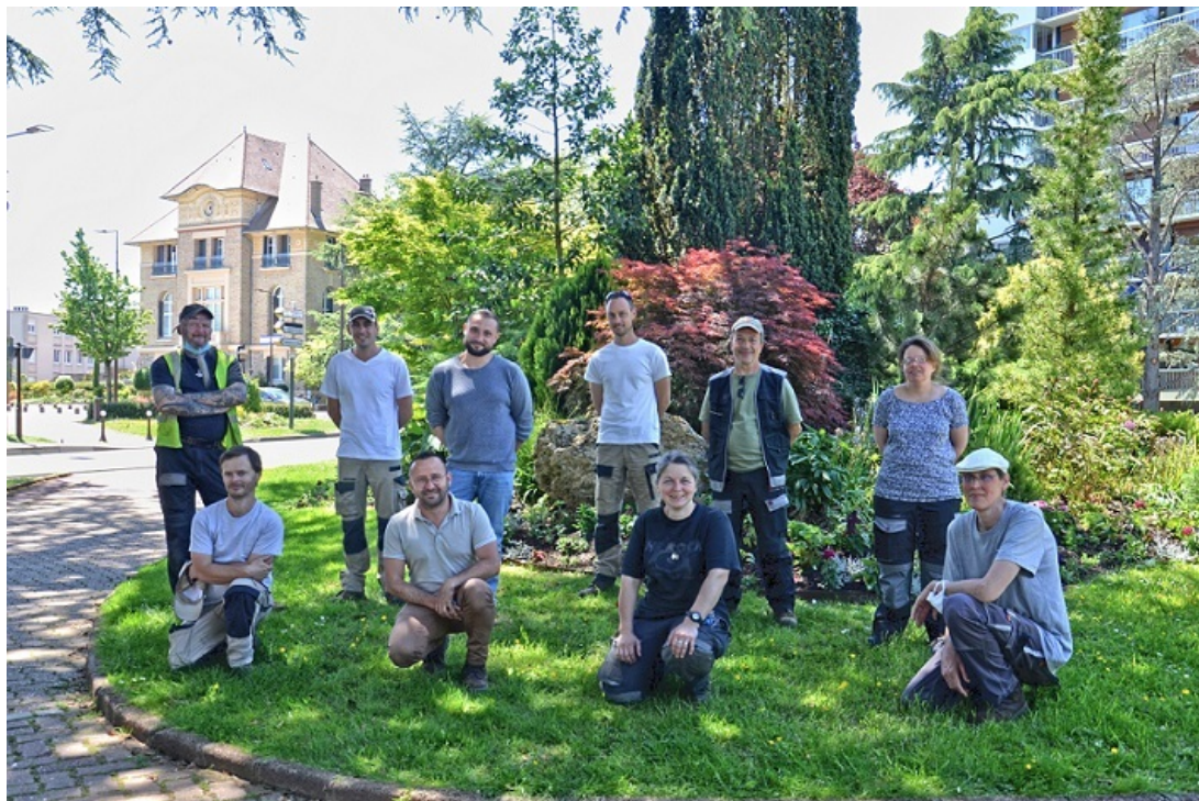
Une partie de l'équipe qui oeuvre à fleurir et entretenir notre ville.

différents services pour garantir la propreté de la ville, l'entretien de la voirie, la cohérence d'urbanisme. Un ensemble d'éléments qui contribue à l'embellissement de la commune. C'est une révolution dans nos métiers.