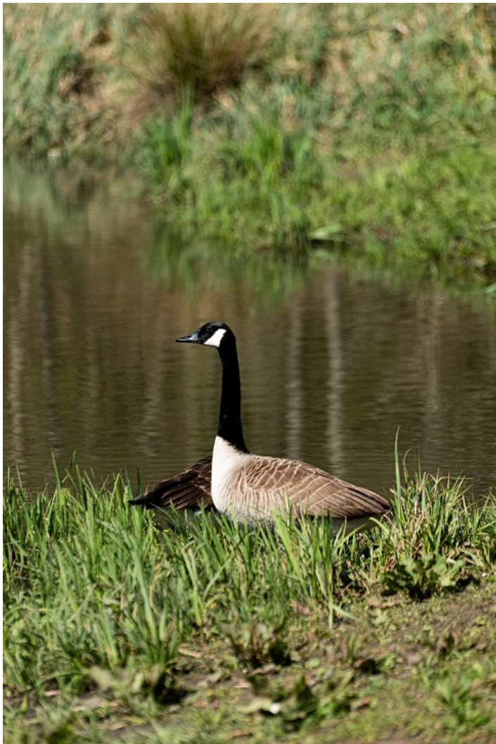
Au printemps, un couple d'oisies bernaches a fait escale à l'étang du Trou aux Gants