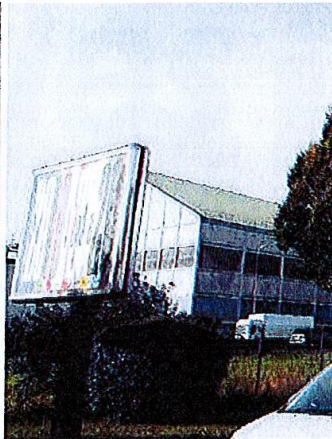
Une réunion publique se tiendra sur le sujet de la publicité extérieure le 16 octobre.

16 octobre à 20h30 en mairie où les habitants pourront poser des questions, faire part de leurs remarques ou tout simplement se renseigner.