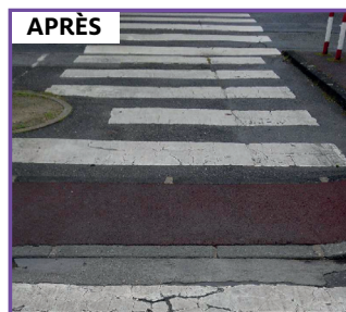
Modification du trottoir au 29 rue de Picardie