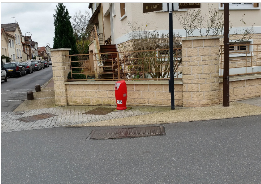
Photo n° 1 - 2 bornes au droit du passage piétons ont été supprimées par « l'ancienne » municipalité (beaucoup de véhicules cognaient dans celles-ci) en attendant de mettre chose pour sécuriser les piétons sur le trottoir. Depuis le début de l'année 2014, ça n'a pas bougé. La photo n° 2 montre les bornes de l'autre côté de la rue.